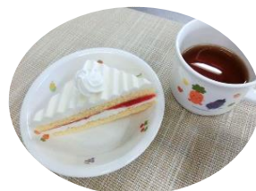
↑ クリスマスケーキ