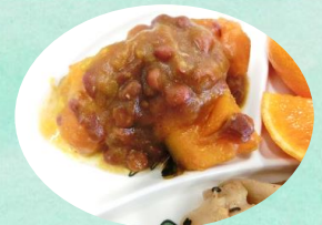
12/20 冬至メニュー かぼちゃのいとこ煮

2月と3月の献立に入れていきます。お友だちと楽しい給食の時間を過ごしてくださいね。