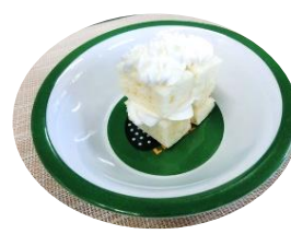
← アレルギー対応おやつ 卵不使用のケーキ