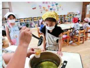
熱いゼリー液は先生に入れてもらいました