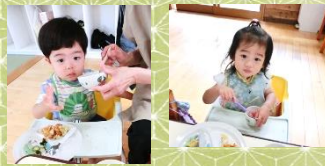
チュルチュル〜 小さい子たちも上手に食べます

完全給食の日は、冷やしうどんと天ぷらでした。うどん好きな子が多いようで、おかわり用のうどんもしっかり食べてくれました。