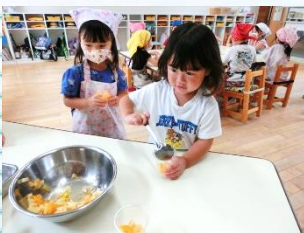
こぼさず入れられるよ

完全給食の日は、冷やしうどんと天ぷらでした。うどん好きな子が多いようで、おかわり用のうどんもしっかり食べてくれました。